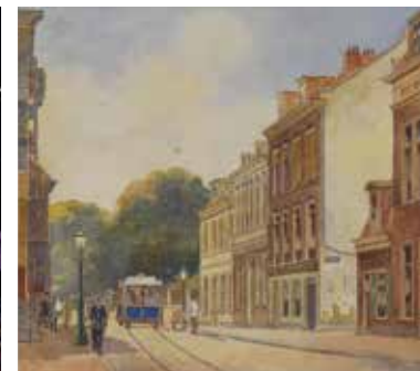
Wie woonden er in Utrecht?, tekening: Arend van de Pol