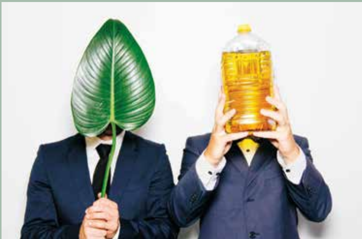
Parlement van de Dingen