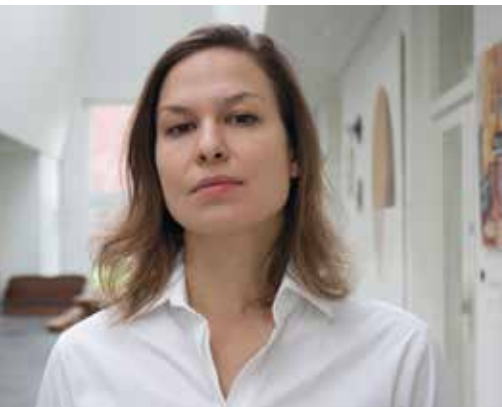
Allemaal Utrechters