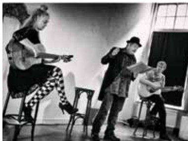
Het Ongehoorde Woord

De belofte van het internet en sociale media is dat ze ons dichterbij elkaar brengen. Maar inmiddels is duidelijk dat ze ook bijdragen aan polarisatie in onze samenleving. Het nieuwsaanbod wordt aangepast aan de voorkeuren van iedere individuele gebruiker, de zogenaamde 'filter bubble'. Het is onduidelijk hoe de algoritmes werken op bijvoorbeeld Facebook en omdat het moeilijk is om een verdienmodel te ontwikkelen voor kwaliteitsberichterijding op het internet heeft 'fake news' vrij spel. Vlak voor de verkiezingen een gesprek over de invloed hiervan op onze democratie. Met gasten uit de politiek, media, technologie en kunst. Entree: € 10,- met lunch € 5,- extra. Reserveren noodzakelijk via de website van Stadsschouwburg Utrecht. impakt.nl