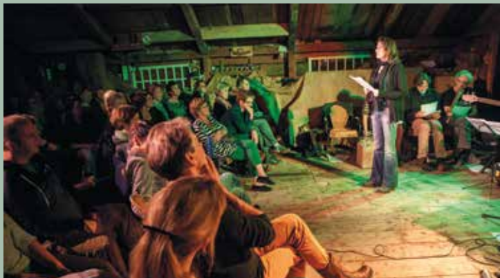
De Vorlesebühne, foto: Hanne Nijhuis