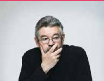
Vrijheidscollege met Maarten van Rossem