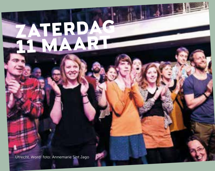
Utrecht, Word!