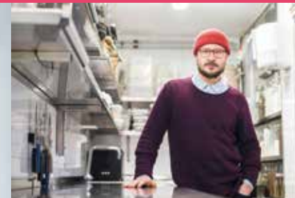
Allemaal Utrechters

In het kader van 25 jaar Bevrijdingsfestival Utrecht geeft historicus en Amerikadeskundige Maarten van Rossem een Vrijheidscollege waarin hij een eigen draai geeft aan het thema van de colleges: de 'Vier Vrijheden van Roosevelt'. Volgens Van Rossem is vandaag de dag de democratie en dus daarmee ook de ware vrijheid, in het gedrang. Hij koppelt dit o.a. aan Amerika en het thema 'populisme'. Dit is tevens de landelijke opening van de Vrijheidscolleges 2017. Deuren open: 12:30 uur. Je dient een (gratis) kaart te reserveren via de website van Vrijheidscolleges. bevrijdingsfestivalutrecht.nl vrijheidscolleges.nl