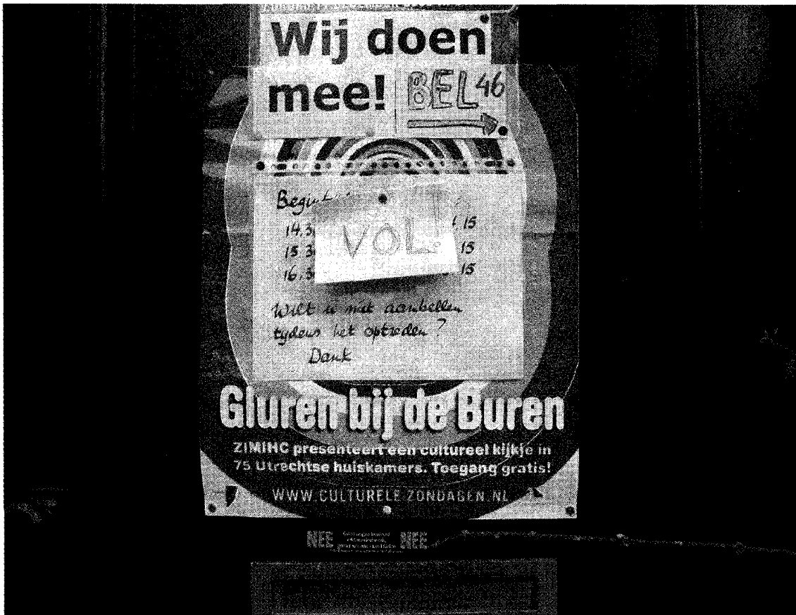
Bezoekers van Gluren bij de Buren kunnen van huis naar huis hopen.